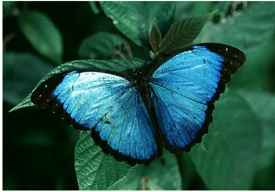
Le papillon de l'espèce Morpho et le bleu iridescent de ses ailes