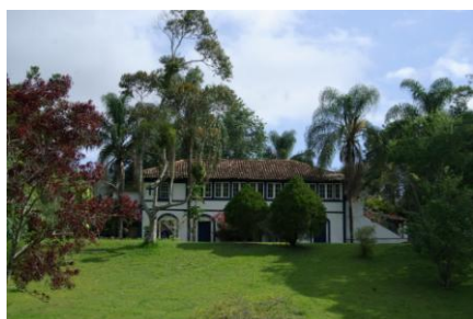
Ferme de café

2 ème jour Parati - Barra do Pirai - Visite de fermes (XVII ème et XVIII ème siècle) connues pour leurs plantations de café.