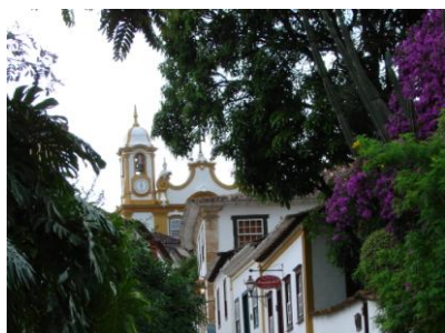
Tiradentes : patrimoine mondial de l'humanité

3 ème jour Barra do Pirai - Tiradentes : Via la vallée de Paraíba avec des fermes anciennes. Un voyage à travers la diversité culturelle, l'histoire et la gastronomie.