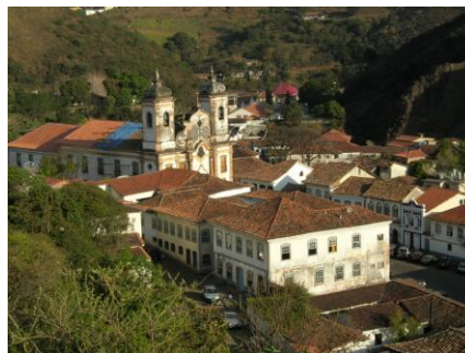
Ouro Preto : ville historique

6 ème jour Ouro Preto : Tour à travers les étroites ruelles de cette splendide cité coloniale baroque, inscrite au Patrimoine mondial par l'UNESCO.