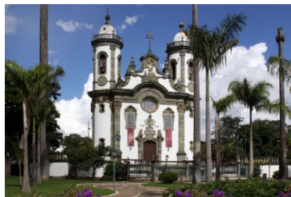
São João del Rei : Église São Francisco de Assis

4 ème jour Tiradentes - São João del Rei : Trajet vers São João del Rei, une autre ville aurifère du XVIII ème siècle. Tour des cités minières. Tiradentes, premier lieu d'établissement d'une communauté lors de la découverte des mines d'or.