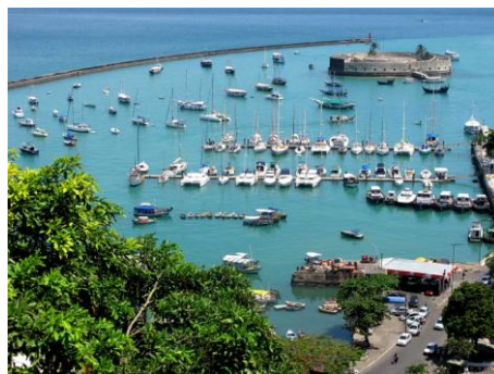
Salvador: Fort São Marcelo, baie de Todos os Santos

8 ème jour Salvador : poursuite individuelle de votre voyage.