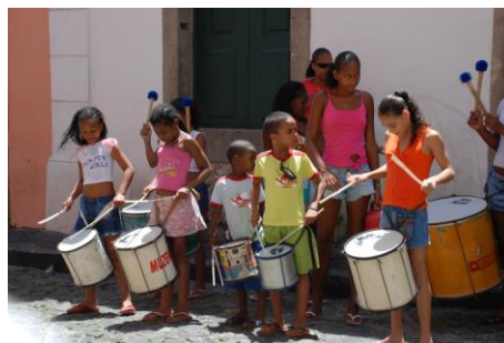
Salvador : quartier du Pelourinho

7 ème jour Salvador : le matin, visite du quartier historique du Pelourinho. Vous pourrez admirer de nombreux bâtiments de style colonial bien conservés, restaurés avec le souci du détail et assister à des présentations de capoeira sur la place principale. Profitez de l'après-midi pour approfondir votre découverte de la vieille ville animée de Salvador.