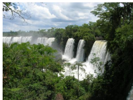
Iguazu : vue des chutes

4 ème jour Rio de Janeiro – Iguazu : le matin, transfert à l'aéroport et vol pour Iguazu. L'après-midi, visite des chutes d'Iguazu du côté brésilien. Le spectacle naturel qui vous attend est à couper le souffle : des millions de litres d'eau dévalent les différentes cascades dans un bruit de tonnerre, emplissant de brume l'air du Parc National de 240'000 hectares. Enchantement garanti !