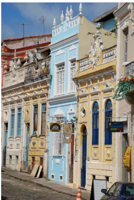
Salvador : quartier du Pelourinho

6 ème jour Iguaçu - Salvador : dans le courant de la journée, transfert à l'aéroport et vol pour Salvador, le chef-lieu de l'Etat de Bahia. Transfert à l'hôtel. Le reste de l'après-midi est libre. Possibilité d'assister à un spectacle folklorique ou de flâner à travers les rues et ruelles de la magnifique vieille ville.