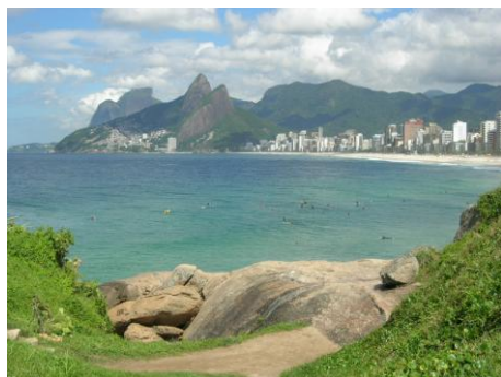
Rio de Janeiro : le Corcovado

2 ème jour Rio de Janeiro : Via la dense végétation de la forêt pluviale de Tijuca, trajet jusqu'à la statue du Christ Rédempteur offrant une vue fantastique sur Rio. Tour de ville et excursion au célèbre Pain de Sucre, haut de 440 mètres. La vue sur la ville, les plages et les îles voisines y est spectaculaire.