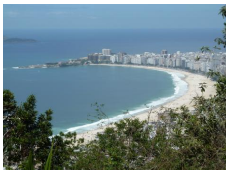
Rio de Janeiro, Copacabana