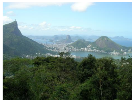
Rio de Janeiro: le Pain de Sucre

2 ème jour Rio de Janeiro : Via la dense végétation de la forêt pluviale de Tijuca, trajet jusqu'à la statue du Christ Rédempteur offrant une vue fantastique sur Rio. Tour de ville et excursion au célèbre Pain de Sucre, haut de 440 mètres. La vue sur la ville, les plages et les îles voisines y est spectaculaire.