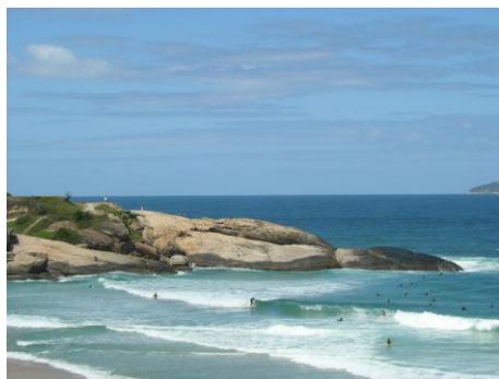
Rio de Janeiro, Arpoador

environs de Rio, les îles tropicales proches de la côte.