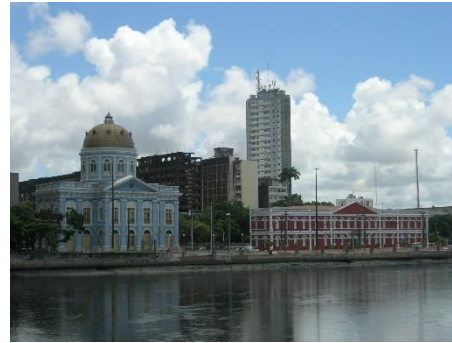
Recife: Assemblée législative

Le tarif aérien des vols intérieurs doit être calculé en fonction du prix de base (y compris taxes d'aéroport et carburant), il varie selon le moment de la réservation et la disponibilité. Sous réserve de modification de prix.