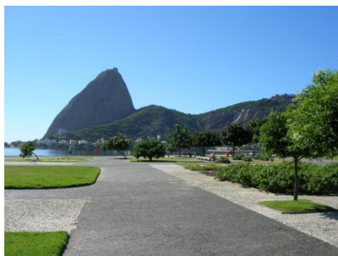
Rio de Janeiro: le Pain de Sucre

2 ème jour Rio de Janeiro : Via la dense végétation de la forêt pluviale de Tijuca, trajet jusqu'à la statue du Christ, dominant la Baie de Guanabara à 700 m d'altitude : vue spectaculaire sur toute la ville de Rio et ses environs qui vous aidera à mieux comprendre la géographie complexe de la Cidade Maravilhosa serties entre l'océan et les morros (=mornes/collines). Le tour continue au célèbre Pain de Sucre, haut de 440 mètres, d'où l'on a une vue époustouflante sur la ville, les collines verdoyantes, les plages et les îles voisines.