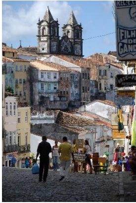
Salvador : quartier du Pelourinho

6 ème jour Parati – Rio - Salvador : Retour à Rio de Janeiro pour prendre un vol à destination de Salvador de Bahia.