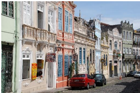
Salvador : quartier du Pelourinho

7 ème jour Salvador : Un tour de ville de Salvador d'une demi-journée vous permettra, notamment, de découvrir l'ancien quartier pittoresque et animé du Pelourinho, riche en témoignages artistiques religieux et coloniaux, ainsi que le célèbre ascenseur Lacerda qui mène de la ville haute au quartier du port et du marché couvert.