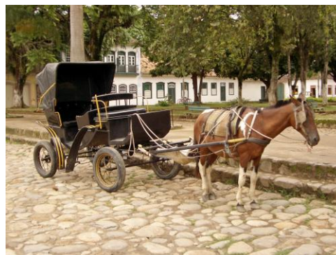
Parati, ville coloniale

4 ème jour Rio de Janeiro – Parati : Superbe trajet par la route, en longeant le littoral et côtoyant une nature exubérante, jusqu'à Parati, une merveilleuse bourgade en bordure de mer où les petites maisons colorées, bordant des ruelles aux imposants pavés disjoints, dégagent un charme fou. De nombreux commerces et de bons restaurants complètent l'image idyllique de ce lieu historique.