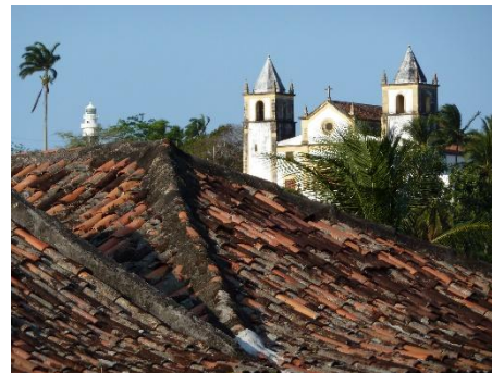
Olinda: Museu do Mamulengo

Vous admirerez également ses fameuses plages. Dans les environs de Recife, Olinda, inscrite au patrimoine mondial de l'UNESCO, ses rues tortueuses et pentues, ses nombreux édifices religieux et ses petites maisons colorées, offre un spectacle qui ne laisse personne indifférent.