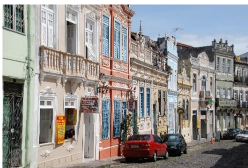
Salvador : quartier du Pelourinho

7 ème jour Salvador da Bahia : Le matin, tour de ville de Salvador, et notamment, du quartier pittoresque du Pelourinho, afin d'apprécier la richesse de son passé empreint d'influence africaine. L'après-midi est libre.