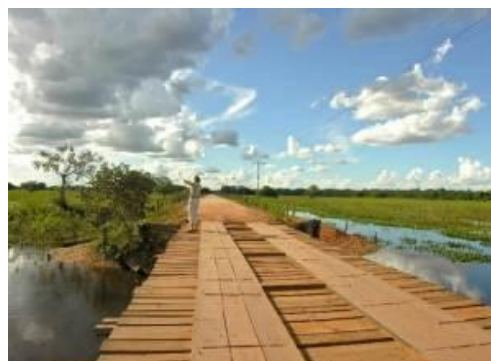
Le Pantanal et ses vastes espaces naturels

5 ème jour Pantanal: Le matin, randonnée à travers la nature luxuriante ; l'après-midi, découverte de paysages enchanteurs lors d'une excursion équestre.