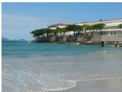
Rio de Janeiro, Forteresse de Copacabana

1 er jour Rio de Janeiro : Arrivée individuelle à Rio de Janeiro et transfert à l'hôtel. L'après-midi, excursion au célèbre Pain de Sucre d'où l'on bénéficie d'une splendide vue sur la ville et sa région.