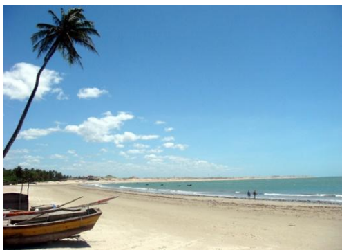
De Fortaleza à São Luis : plage d'Icarai

8 ème jour Salvador – Fortaleza : transfert à l'aéroport et vol pour Fortaleza. Transfert à l'hôtel.