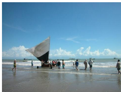
De Fortaleza à São Luis, en passant par Jericoacoara

12 ème jour Jericoacoara – Parnaíba : Départ pour Parnaíba. Traversée en bac de deux rivières et arrêt à Chaval, un adorable village blotti entre falaises, lagunes et palmiers.