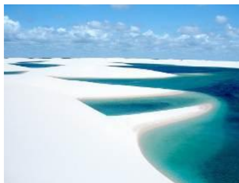
De Fortaleza à São Luis, en passant par les Lençois Maranhenses, c'est la « Route des Emotions » !

14 ème jour Atins - Barreirinhas : Le matin, trajet en bateau sur la rivière Preguiças jusqu'au petit village de pêcheurs de Mandacaru abritant un phare. Poursuite en bateau jusqu'à Barreirinhas.