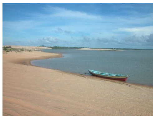
De Fortaleza à São Luis, en passant par Jericoacoara

11 ème jour Jericoacoara : (Jeri) : promenade en bordure de mer pour connaître le symbole de Jeri : la Pedra Furada, la « Pierre Trouée », formation rocheuse que l'érosion de la mer et du vent a percée. La fin de l'après-midi est