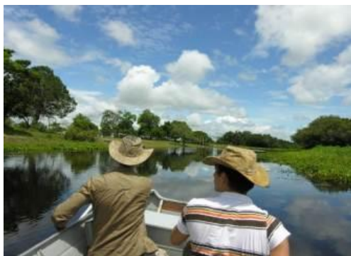
Le Pantanal et ses vastes espaces naturels

libre, afin de profiter des plages de rêve et des pittoresques paysages de dunes.