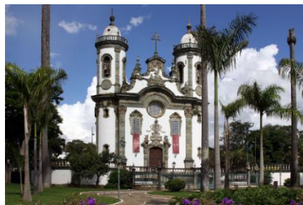
São João del Rei : Église São Francisco de Assis

4 ème jour Tiradentes – São João del Rei : Trajet vers São João del Rei, une autre ville aurifère du XVIII ème siècle. Tour des cités minières. Tiradentes, premier lieu d'établissement d'une communauté lors de la découverte des mines d'or.